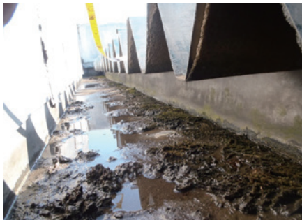
谷どい・汚泥状態の堆積物