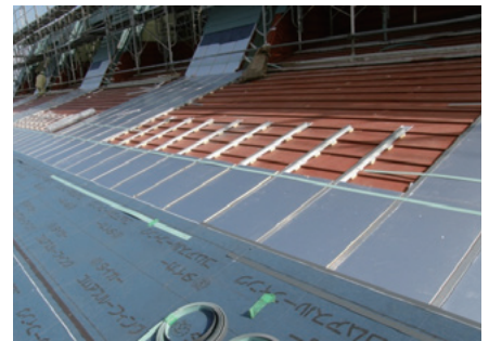
横ぶき屋根の改修