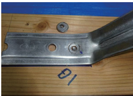
木造での折板接合部確認試験