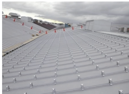
瓦棒ぶき屋根の改修